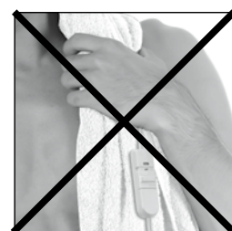
Do not use heating pad bunched up