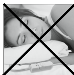
Do not sleep while using heating pad