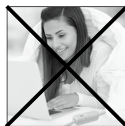
Do not use under covers