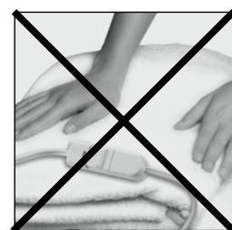
Do not sharply fold or crease heating pad