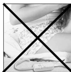
Do not sit on heating pad