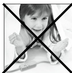
Not for use by children

For additional warnings, please see Important Safety Instructions as well as Cautions in this booklet.